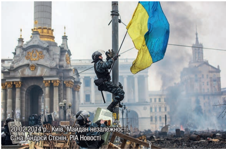
20.02.2014 р. Київ, Майдан незалежності.

На чолі держави – колишній генеральний продюсер телеканалу «Інтер» часів Віктора Януковича. На чолі парламенту – колишній активіст Партії регіонів. На чолі президентського офісу – уповноважений уряду Миколи Азарова з боротьби із корупцією. І це – тільки про кадри, а можна було б говорити і про незаперечні факти, які свідчать якщо не про презирство, то принаймні про байдужість нової влади до всіх тих цінностей, які захищали учасники Майдану.