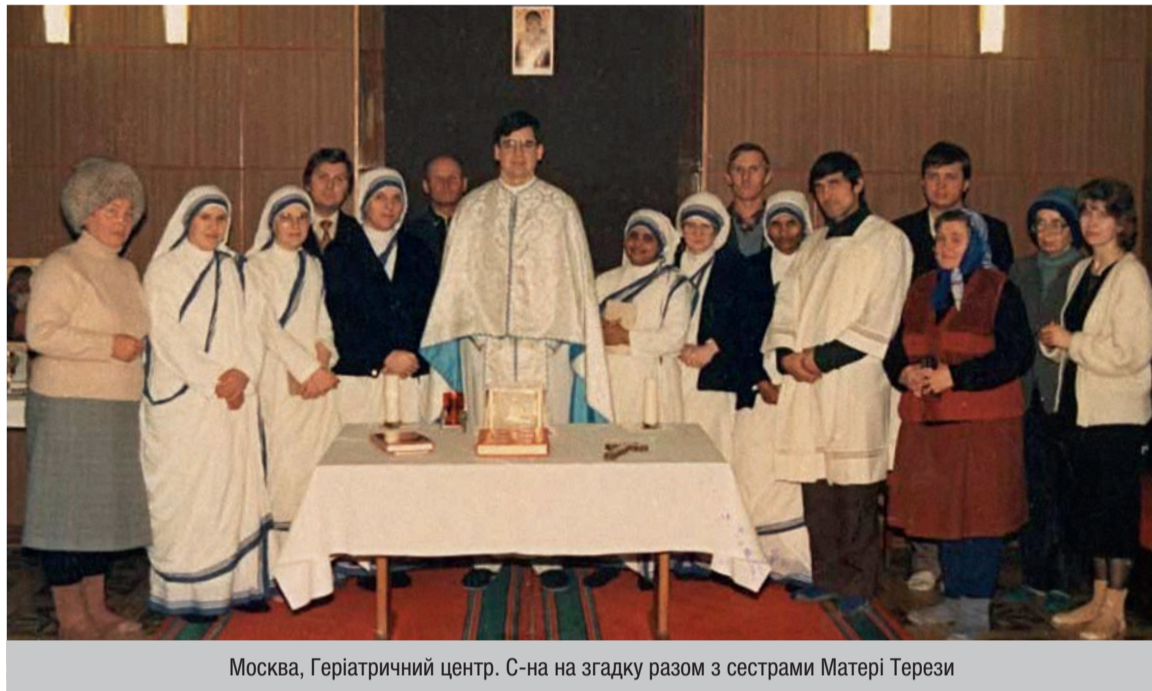
Москва, Геріатричний центр. С-на на згадку разом з сестрами Матері Терези

Для нас значення спілкування з добродіями дітьми матері Терези перевищувало межі людських цінностей. Після оскаженілої нагінки міліції та спецназів, що чудово замінили історичне ЧК, у тихій скромній чернечій обителі ми переставали бути загнаним звіром, ми знову ставали людьми. Після Літургії, яку отець Брайєн-Колодїйчук відправляв по суботах та неділях у нашому, греко-